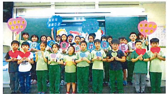
說明：中年級「孝口常開」感恩影片錄製剪影