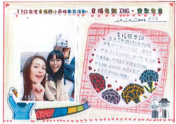
說明：高年級「齊聚孝意」感恩傳單成 品