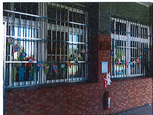
說明：低年級「有孝旗現」三角旗感恩卡展示剪影