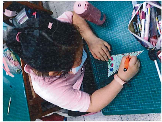
說明：低年級製作「有孝旗現」三角旗感恩卡剪影