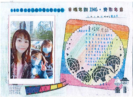
說明：高年級「齊聚孝意」感恩傳單成 品