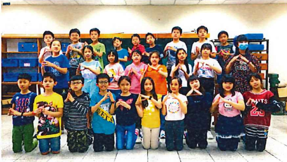
說明：中年級「孝口常開」感恩影片錄製剪影