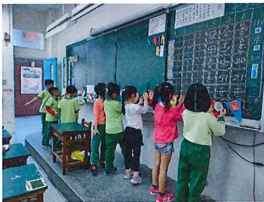
說明：低年級製作「有孝旗現」三角旗感恩卡剪影