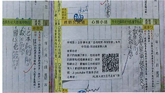
說明：全體「喜樂傳孝」以聯絡簿小貼方式傳達大家的感恩之心