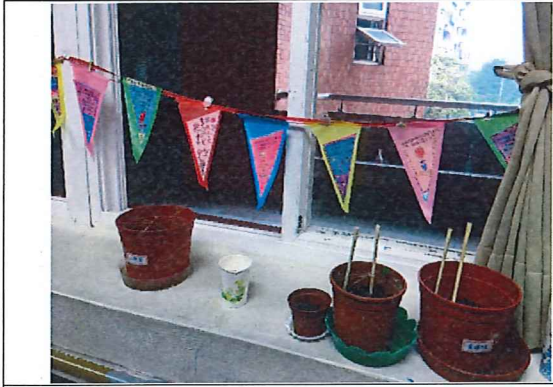
說明：低年級「有孝旗現」三角旗感恩卡展示剪影