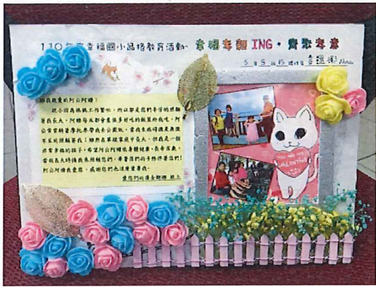
說明：高年級「齊聚孝意」感恩傳單成 品