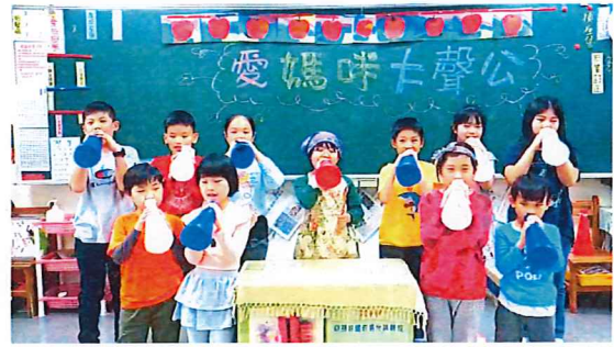
說明：中年級「孝口常開」感恩影片錄製剪影