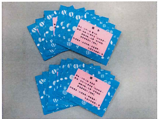
說明：全校「獎落誰家」六年級獎品和 獎卡