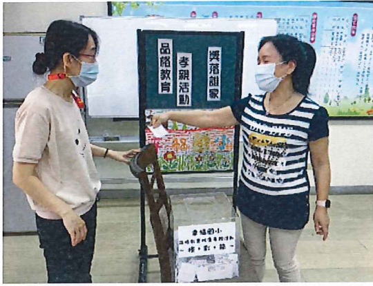
說明：全校「獎券誰家」由幸福大家長~校長抽出幸運的「幸福兒童」