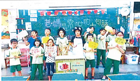
說明：中年級「孝口常開」感恩影片錄製剪影