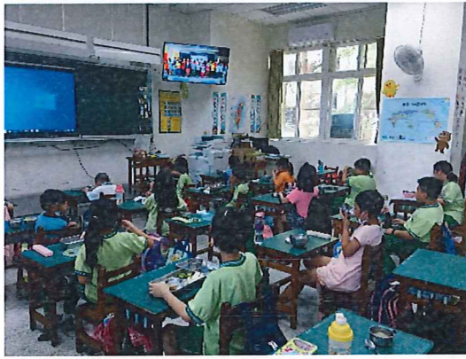
說明：全體「喜樂傳孝」於中午用餐時間播放中年級孝口常開之感恩影片