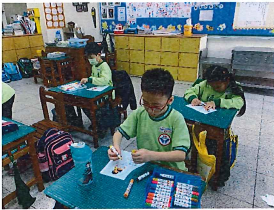
說明：低年級製作「有孝旗現」三角旗感恩卡剪影