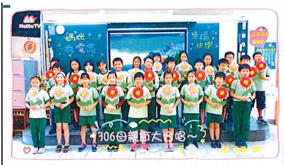
說明：中年級「孝口常開」感恩影片錄製剪影