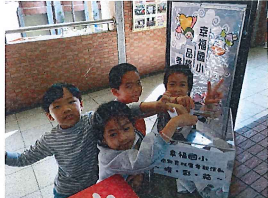
說明：全校「獎落誰家」參加各年級活 動後拿到摸彩券，填寫完後投入摸彩箱