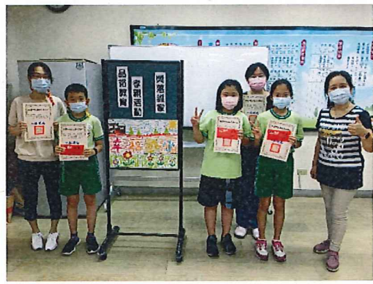
說明：全校「獎落誰家」於校長室頒獎 合影